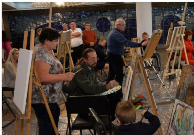
Всероссийская акция «Ночь искусств»