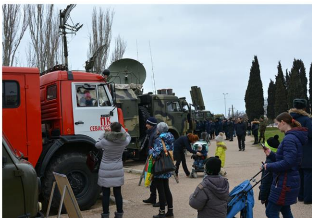
Выставка военной техники, торжественное собрание и праздничный концерт в КИЦ