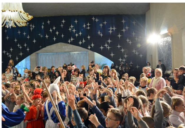
Игра - путешествие «Новый год у ворот»