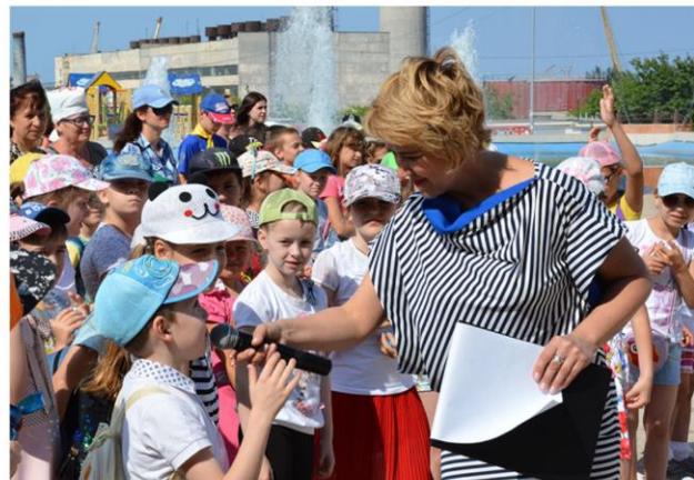
Интерактивная программа «Мир детства» к Международному дню защиты детей