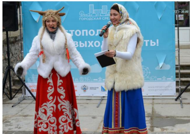
Зимний фестиваль «Севастополь, выходи гулять!» в рамках Всероссийского приоритетного проекта «Формирование комфортной городской среды»