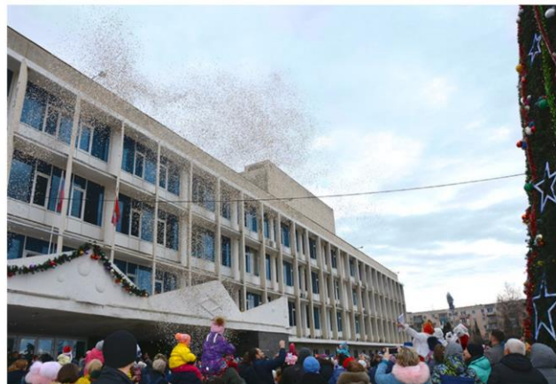
Народное гулянье «Фантастическая ёлка!» на площади КИЦ