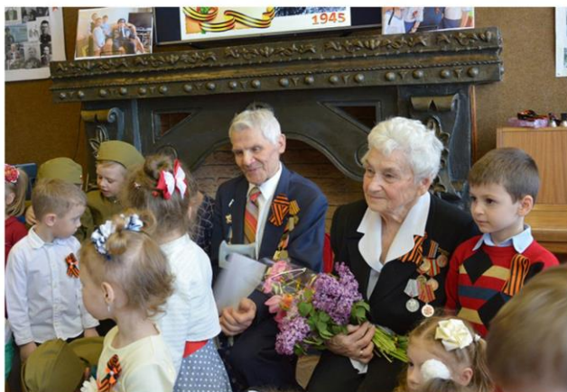
Встреча с ветераном Великой Отечественной войны, в рамках проекта «Судьбы, опаленные войной»