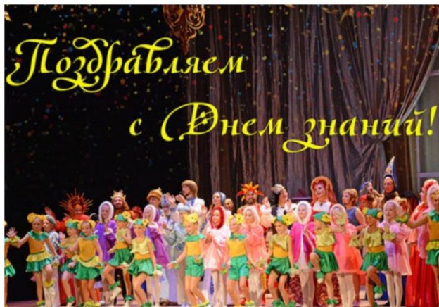
Интерактивное представление «В мире сказок», посвященное Дню знаний