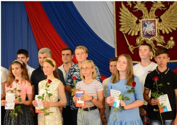
Праздничная программа «Мы-юная смена России» и торжественная церемония вручения паспортов