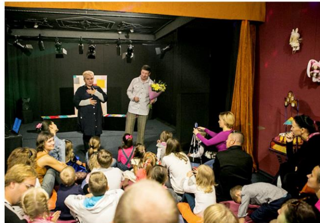
Открытие 4 театрального сезона в Театре им. Кукол