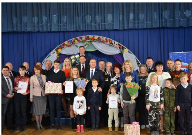
Награждение победителей социального проекта «Ангел по имени мама»