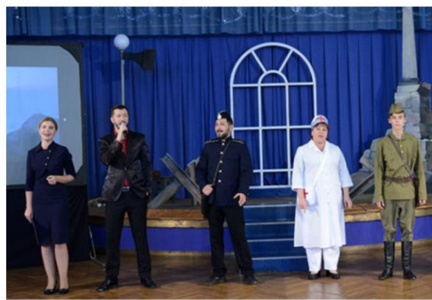
Литературно-патриотический час, приуроченный к 77 - ой годовщине начала второй обороны Севастополя 1941-1942 г.г.