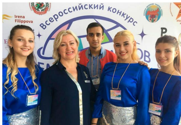
Участие образцового вокального ансамбля «Маленький принц» в финальном этапе V всероссийского конкурса «Земля талантов»