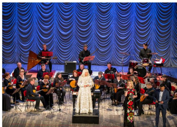
Концерт «Весеннее настроение» русского народного оркестра «Жемчужина России»