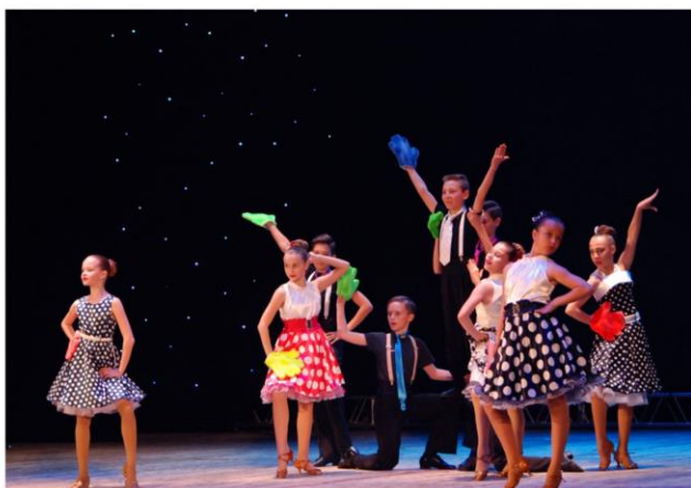
Творческий вечер образцового ансамбля бального танца «Мириданс», посвященный Международному дню танца