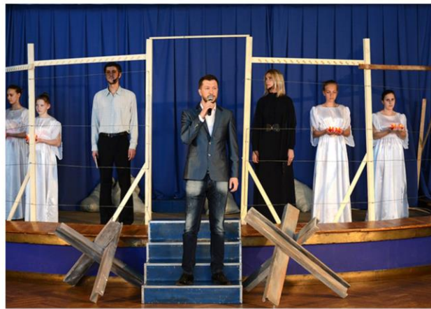
Тематический вечер «Память сердца», приуроченный к Международному дню освобождения узников фашистских концлагерей