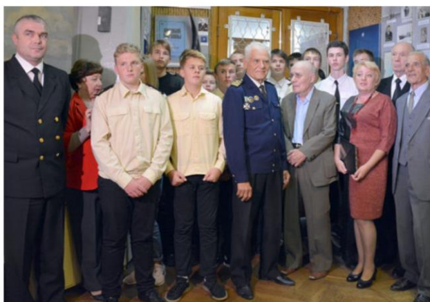
Встреча ветеранов рыбной отрасли и студентов, посвященная 60-летию первой научно-промысловой экспедиции рыбаков Крыма в Атлантику