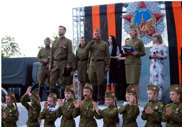
Праздничный концерт в рамках городского фестиваля «РАДИ ЖИЗНИ НА ЗЕМЛЕ»»