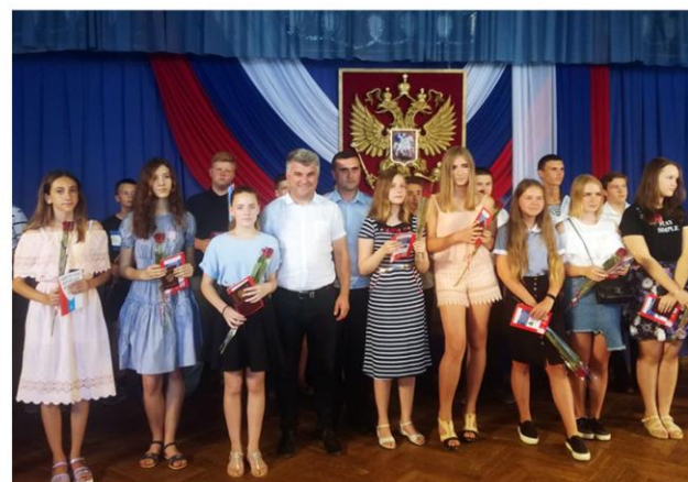
Праздничный концерт «Тебе, любимый город, посвящаем» и торжественное вручение паспортов