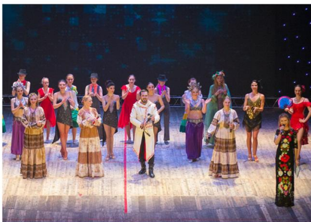
Концертная программа «Мечты» народного ансамбля традиционной культуры «Марьины кудесы» и народного ансамбля эстрадного танца «Мистеризум»