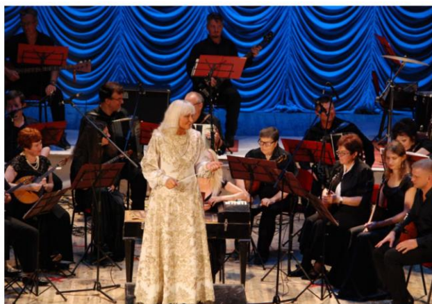
Концертная программа «Музыкальный каламбур» русского народного оркестра «Жемчужина России»