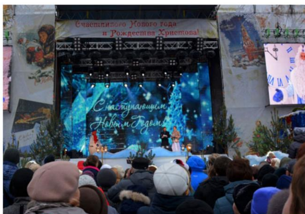
Открытие главной новогодней елочки на центральной площади имени П.С. Нахимова