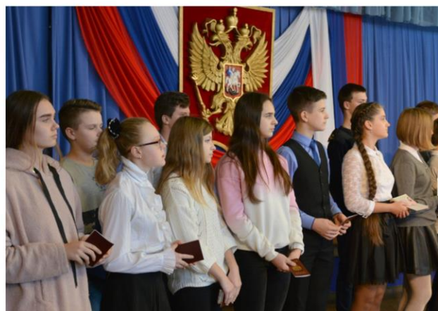
Торжественная церемония вручения паспортов