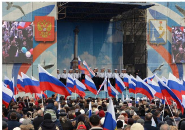
Праздничный концерт на главной площади города, посвящённый Дню защитника Отечества