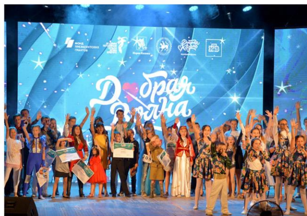
Культурно-благотворительный фестиваль «Добрая волна»