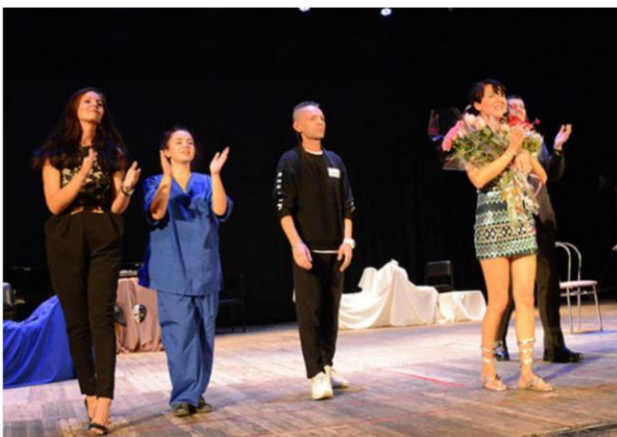
Премьера спектакля «La Divina» народный театр драмы «Психо Дель Арт»