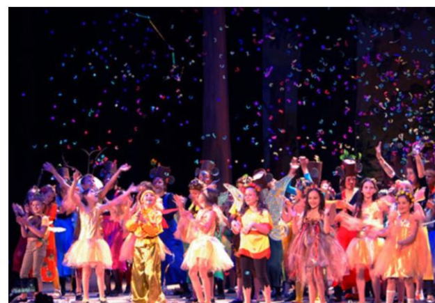
Премьера спектакля «Минитопия и волшебный плод» театральной студии «А-ФИШКА»