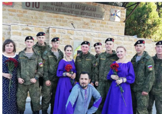
Праздничный концерт народного ансамбля традиционной культуры «Марьины кудесы» 810 отдельная ордена Жукова бригада морской пехоты