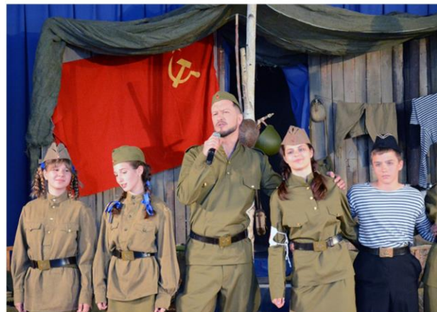
Военно-патриотический квест «Я - патриот!»