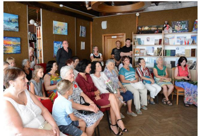
Музыкально-поэтический вечер, посвященный 220-летию со дня рождения русского поэта А.А.Дельвига