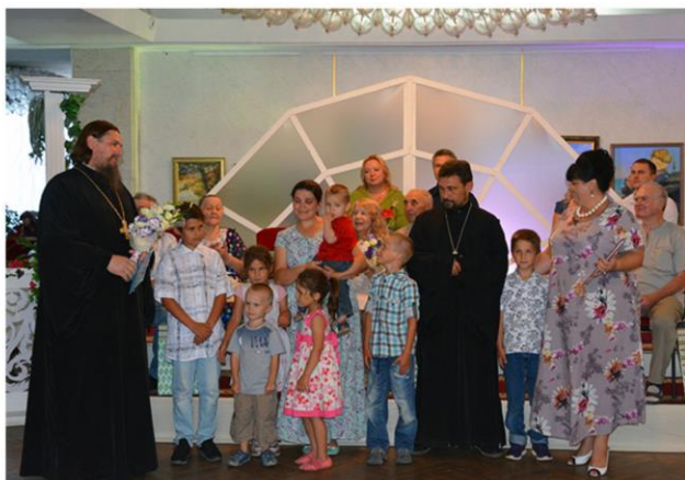
Всероссийский «День семьи, любви и верности»