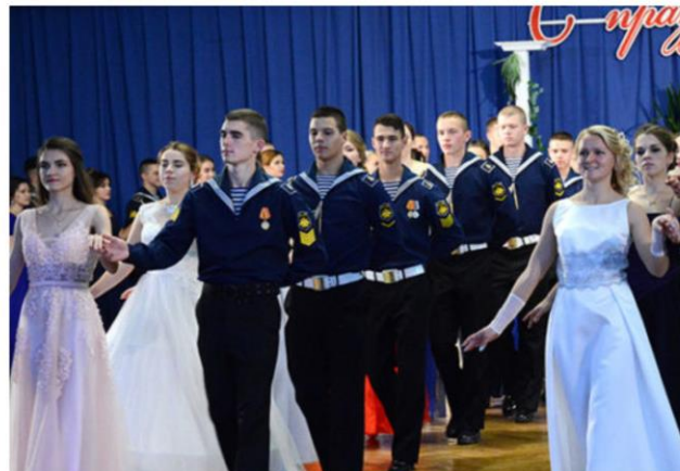
Осенний бал курсантов Черноморского высшего военно-морского училища имени П.С.Нахимова