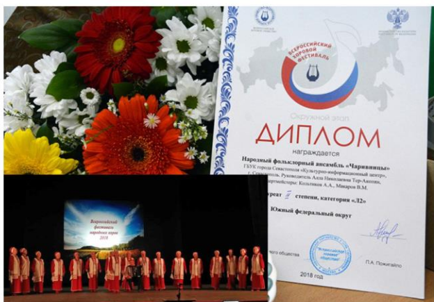
Участие народного фольклорного ансамбля «Чаривницы» в Всероссийском хоровом фестивале