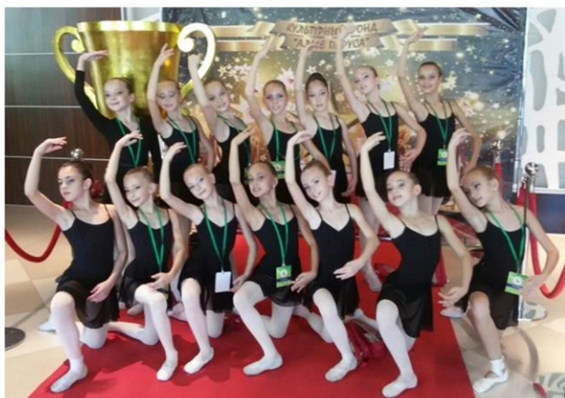
Участие образцовой студии классического балета «Классик» в Всероссийском конкурсе «Кубок Победителей»