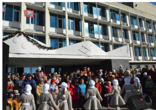
Праздничная программа «Веселое Рождество»