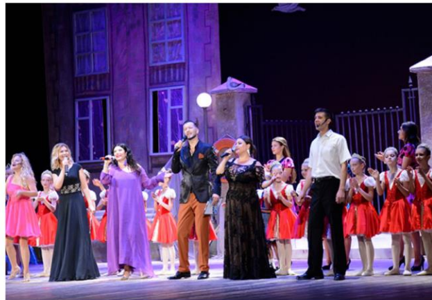
Торжественное собрание и праздничный концерт ко Дню рыбака