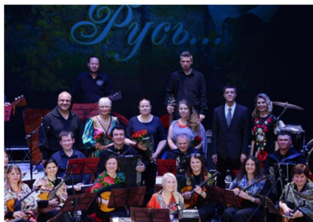
Премьера программы «Есенинская Русь» оркестра русских народных инструментов «Жемчужина России»