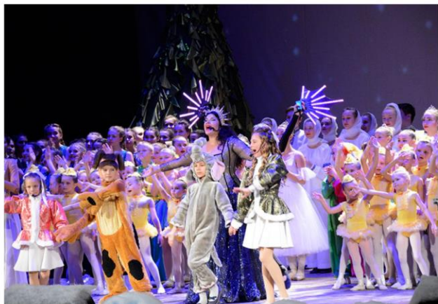
Премьера концерта - сказки «Путешествие за Рождественской звездой»