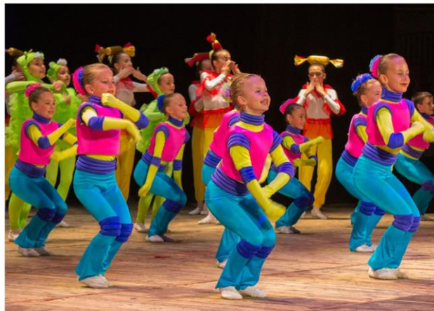
Танцевальное шоу «Мир, в котором мы живем» образцового хореографического ансамбля «Атлантика»