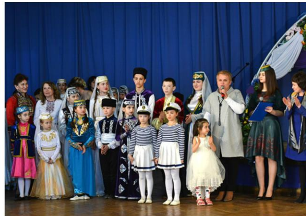
Тематическая программа «Навруз-байрам - праздник весны»