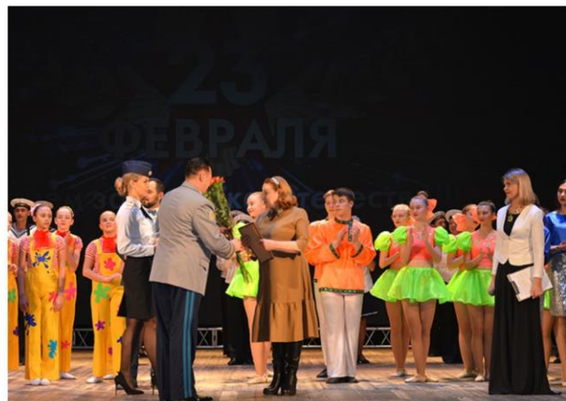
Торжественное собрание и праздничный концерт, посвящённые Дню защитника Отечества и 100-летию создания Красной Армии