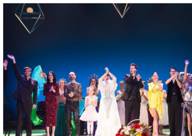
Концерт- феерия «Богини»