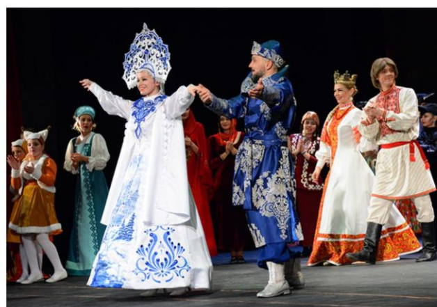
Премьера музыкальной сказки «Тайна заколдованного царевича»