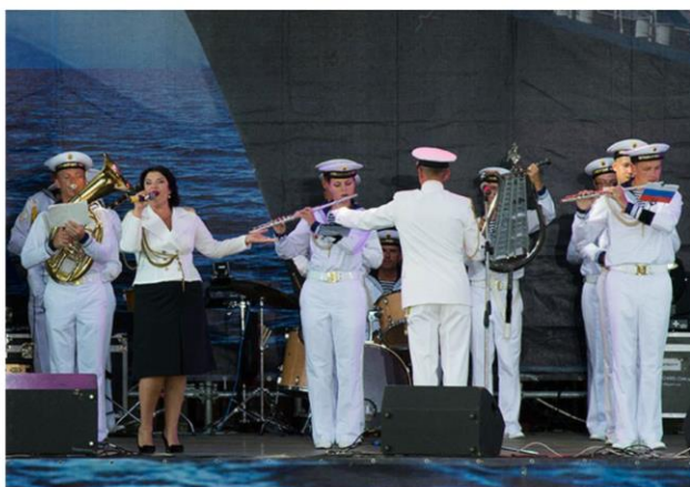
Концерт ко Дню Военно-Морского Флота России на площади П.С. Нахимова