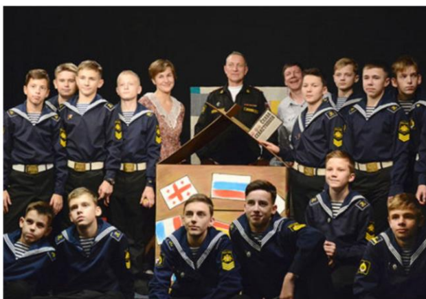
Шефский спектакль «Терем Ок.» для кадет Нахимовского военно – морского училища (Севастопольского президентского кадетского училища)