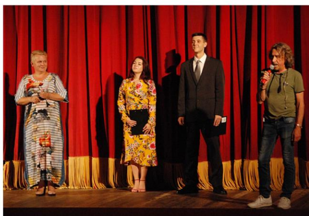
XI фестиваль малых театральных форм «Закрытый покаZ»