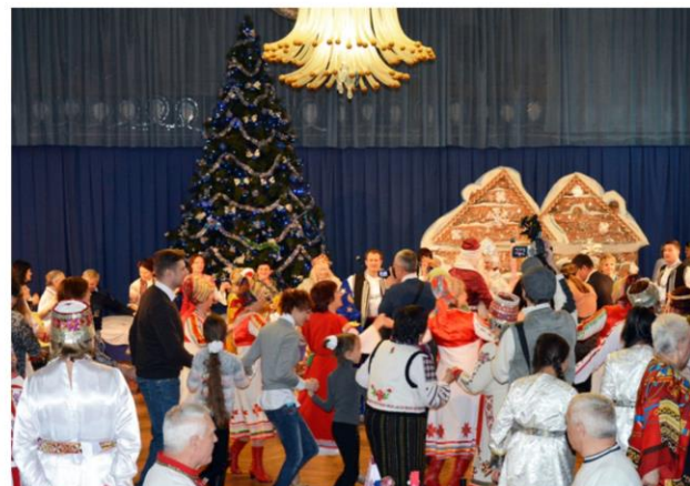
Тематический вечер «Зимние праздники народов Крыма»