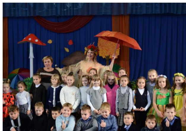
Театрализованное квест-путешествие «Праздник осени»