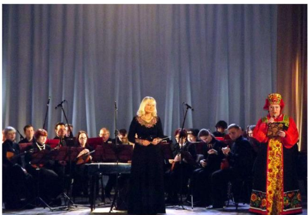
Концерт русского народного оркестра «Жемчужина России», в рамках акции «Севастополь выбирает будущее!»