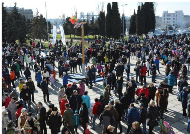
Народное гулянье «Масленица по – флотски»