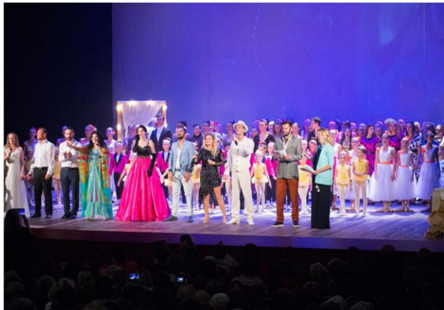
Открытие нового творческого сезона