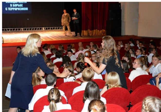
Диспут-диалог «Нет террору! Молодежь-за мир!» приуроченный ко Дню солидарности в борьбе с терроризмом