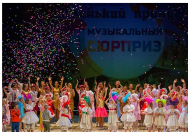
Концерт «Музыкальный сюрприз» образцового вокального ансамбля «Маленький принц»