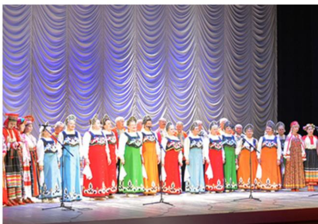
Региональный этап Всероссийского хорового фестиваля