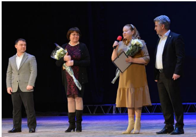
Торжественное собрание и праздничный концерт, посвященные Международному женскому дню