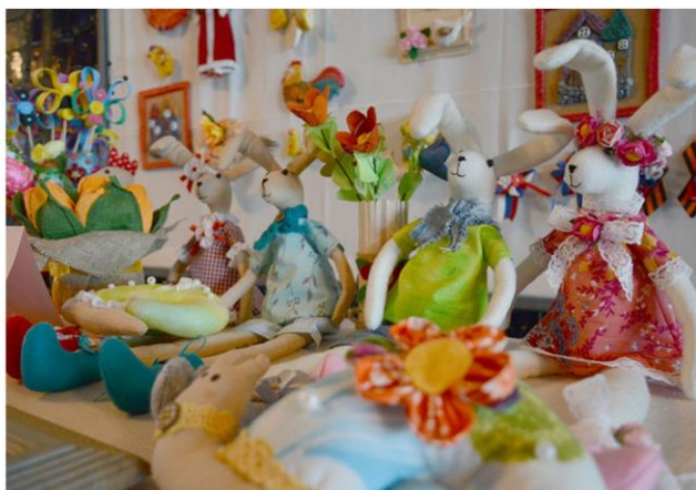
Выставка мастеров декоративно - прикладного творчества «Пасхальные узоры»