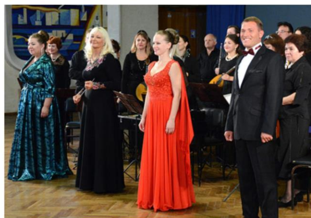
Праздничный концерт русского народного оркестра «Жемчужина России», посвященный Международному дню музыки