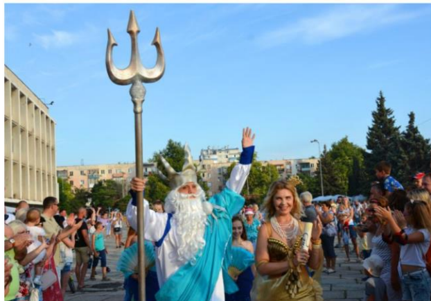
Народное гулянье ко Дню рыбака