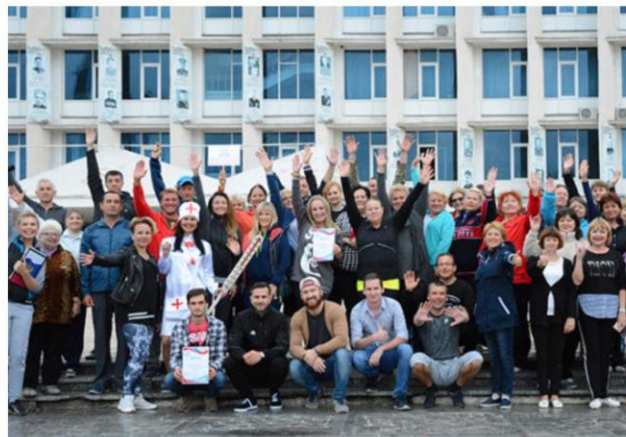
Участие сотрудников КИЦ в Всероссийской акции «Кросс нации-2018»