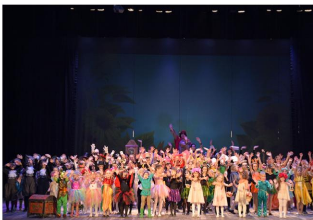
Премьера спектакля «Сказки из сундучка тетушки Розы»