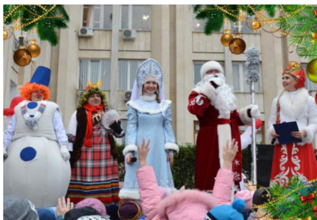
Торжественное открытие новогодней елки Гагаринского р-на