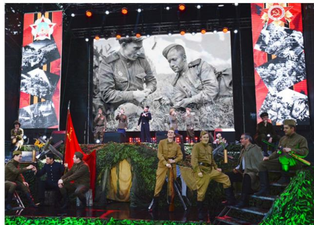
Музыкально-театрализованный проект «Май! Весна! Победа!» на площади П.С. Нахимова