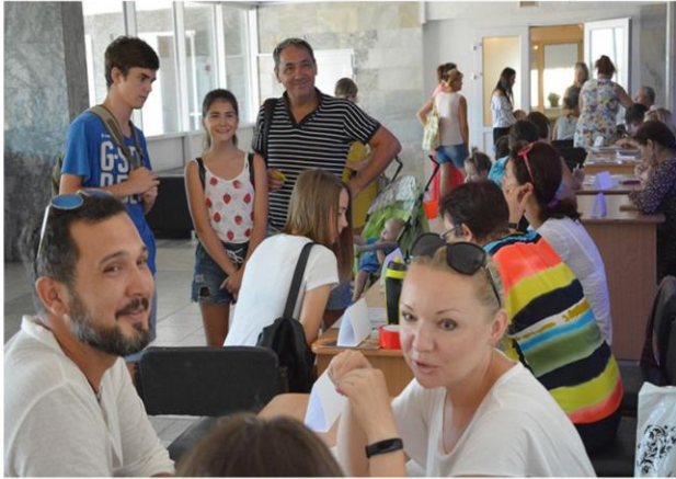
День открытых дверей «Открой свои таланты в КИЦ!»