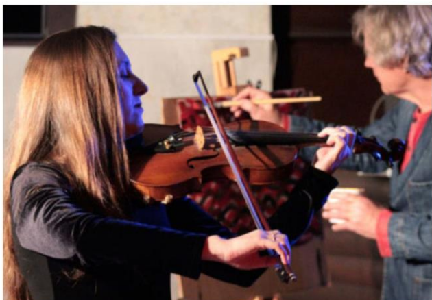
Поэтический театр периметра «Психо Дель Арт» - «Крещение»