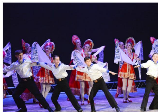
Праздничный концерт, посвященный четвертой годовщине воссоединения Крыма с Россией