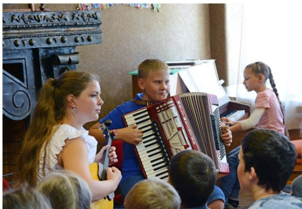
Литературно — поэтическая программа «Люблю тебя, мой Севастополь»