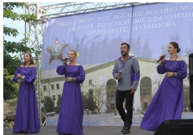
Концерт ансамбля «Марьины кудесы» в ЧВВМУ им.П.С.Нахимова