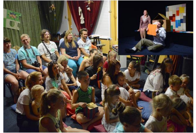
Премьера спектакля «Терем Ок.» Театр им. Кукол