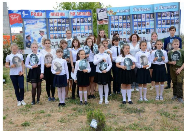
Патриотическая акция по высадке деревьев «Лес Победы», в рамках городского фестиваля «РАДИ ЖИЗНИ НА ЗЕМЛЕ»»