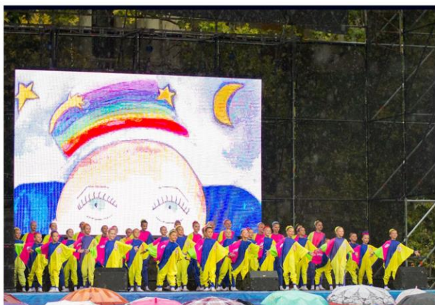
Информационно-оздоровительная акция «Волна здоровья»